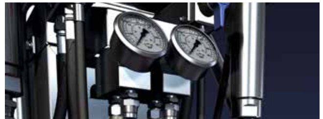
Calefactor de manguera SureFire™